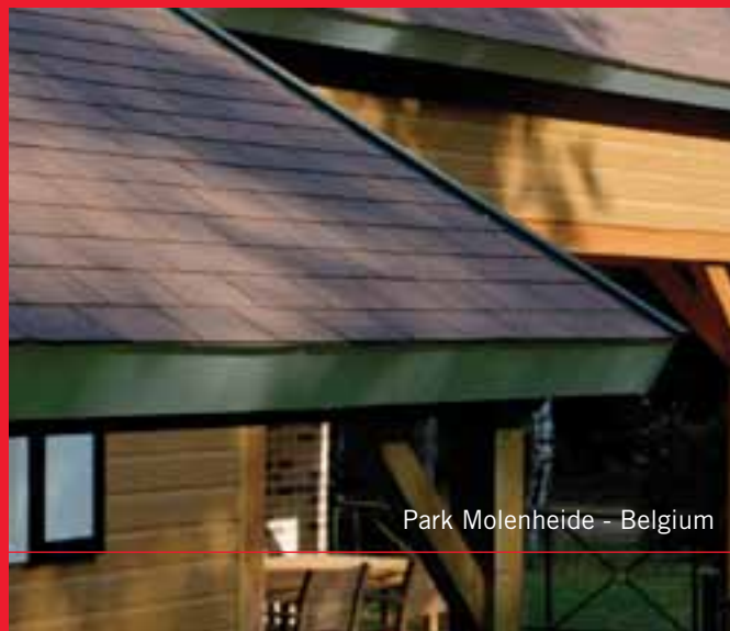
Park Molenheide - Belgium